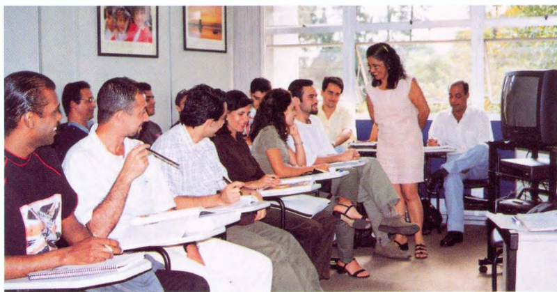
Sala de aula CEA 1999

A Escola de Governo ainda mantém parcerias e cooperação técnica com os seguintes organismos internacionais: Aston Business School - Inglaterra, Bird - Banco Mundial, British Council, Fundação Ford, Fundação Konrad Adenauer, London School of Economics - LSE/Inglaterra, Programa das Nações Unidas para o Desenvolvimento - PNUD, Universidade Autônoma de Barcelona, Universidade de Stetson e Universidade de Wisconsin, dos Estados Unidos.