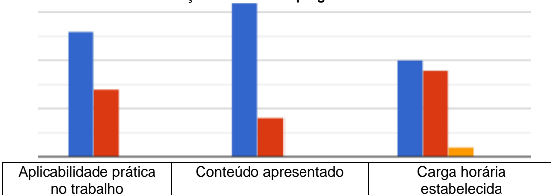
Gráfico 1: Avaliação do conteúdo programático/tema/assunto