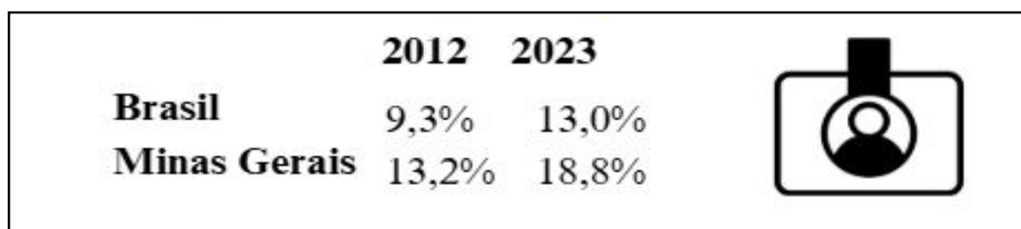
Figura 4: Proporção de empregados domésticos sem carteira assinada que contribuía para a Previdência Social (%)