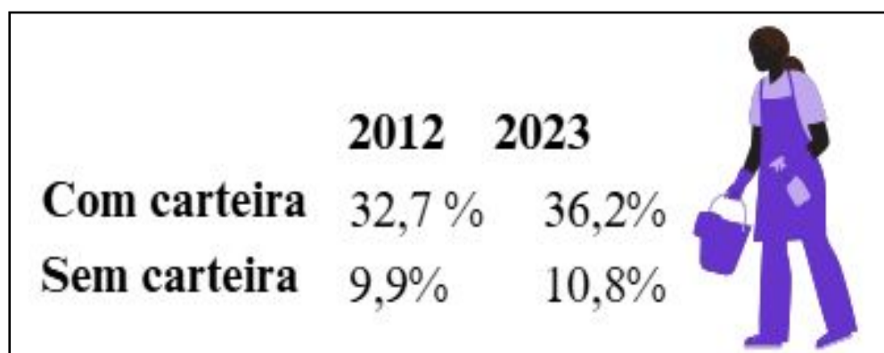
Figura 5: Proporção de empregados domésticos que prestava serviço em mais de um domicílio – Minas Gerais (%)