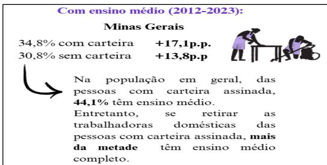
Figura 3: Escolarização das trabalhadoras domésticas em Minas Gerais – 2012-2023

Fonte: Dados básicos: Fundação João Pinheiro (2023). Elaboração própria.