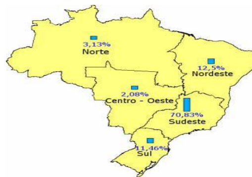
FIGURA 1 - Guardas Municipais nos Estados Brasileiros no ano de 2004

A Guarda está distribuída de forma heterogênea no país, conforme mapa baseado no relatório do departamento de pesquisa em segurança pública da Secretaria Nacional de Segurança Pública 3 (SENASP). Percebe-se que há uma concentração maior na região sudeste.