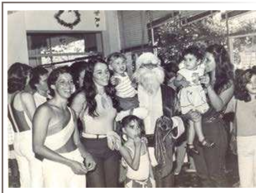
Festa de Natal dos funcionários no restaurante da Fundação João Pinheiro – 23 dez. 1981

É uma fase marcada pela crescente ampliação do número de associados, com ingresso de agregados oriundos de entidades contratantes de mão de obra e com vínculos com a FJP. Também é assinada a ampliação do contrato de comodato entre FJP e AEFJP, cedendo área para construção de quadras de esportes, piscinas, prédio com restaurante, salas de jogos e cômodos para atividades culturais, o que seria uma sede campestre. Além disso, foram celebrados diversos outros convênios e realizados muitos eventos comemorativos.