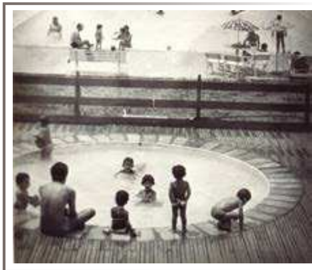
Área recreativa da AEFJP Bairro Horto – 1982