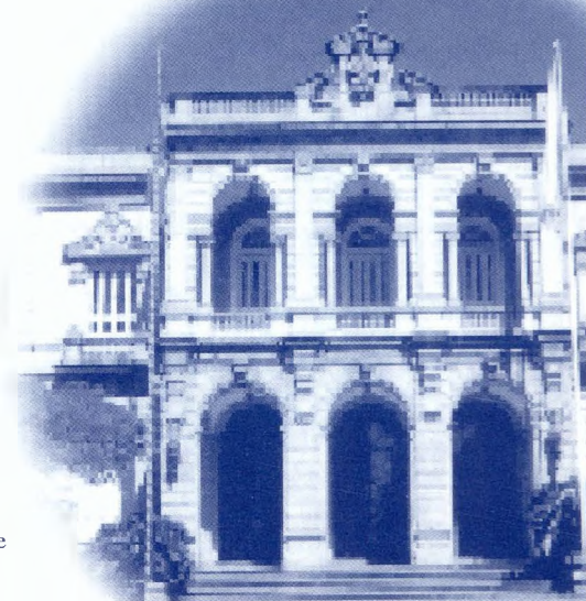
Palácio da Liberdade