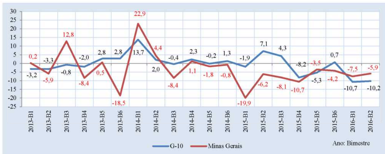
Gráfico 1: Transferências correntes: Taxa de variação real no bimestre (em relação ao mesmo bimestre do ano anterior) – Minas Gerais e G10 (SP, RJ, MG, RS, PR, SC, DF, BA, GO e PE) – 1º bim. 2013–2º bim. 2016