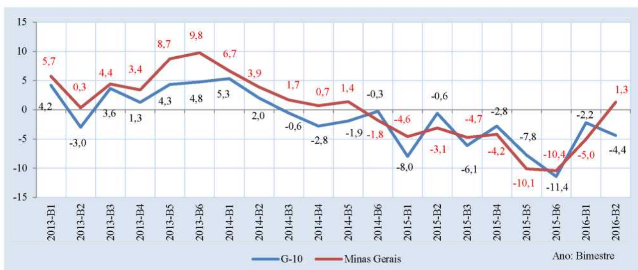
Gráfico 2: Receita tributária: Taxa de variação real 35 no bimestre (em relação ao mesmo bimestre do ano anterior) – Minas Gerais e G-10 (SP, RJ, MG, RS, PR, SC, DF, BA, GO e PE) – 1º bim. 2013–2º bim. 2016

Fonte: Relatório Resumido da Execução Orçamentária (RREO) dos estados; Secretaria do Tesouro Nacional (STN/MF), Anexo 3 (LRF, Art. 53, inciso I).