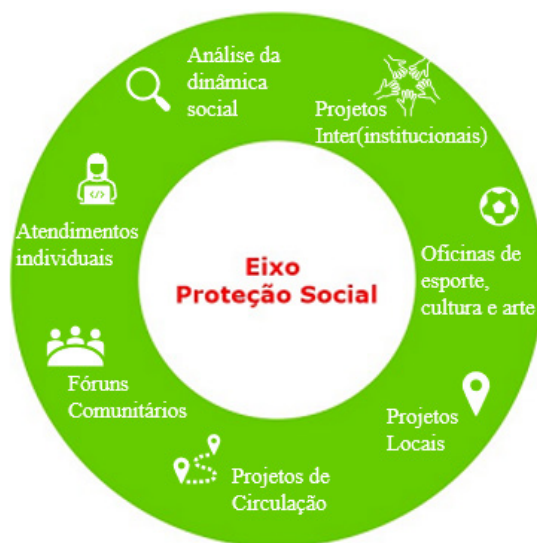
Figura 2 – Eixo Proteção Social do programa Fica Vivo!