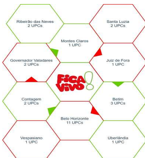
Figura 1 - Cobertura atual do Fica Vivo!