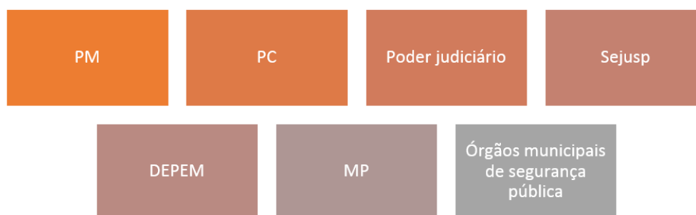
Figura 3 – Atores do Eixo intervenção estratégica do programa Fica Vivo!