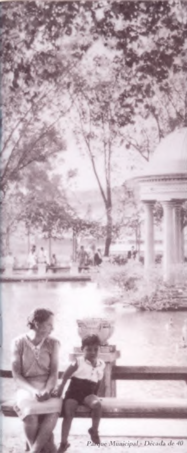
Parque Municipal - Década de 40