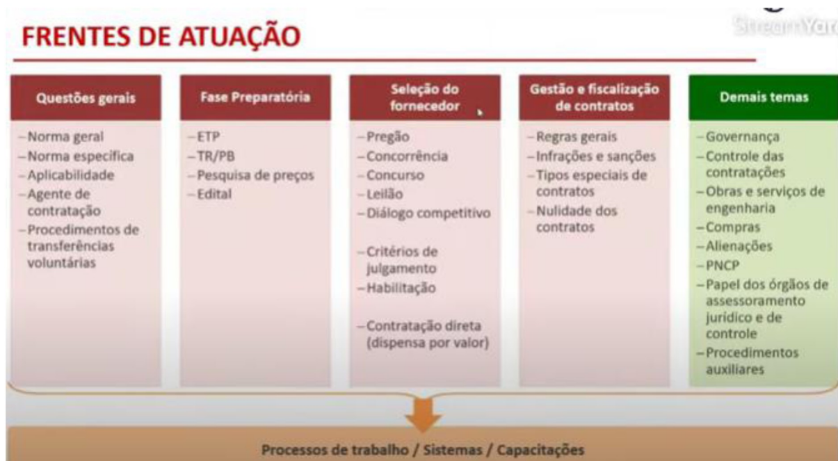
Figura 3: Conteúdo por frente de atuação – Grupo de Trabalho da Nova Lei de Licitações e Contratos

canal do YouTube da SEPLAG, em 7 de outubro de 2021, conforme representado na Figura 3.