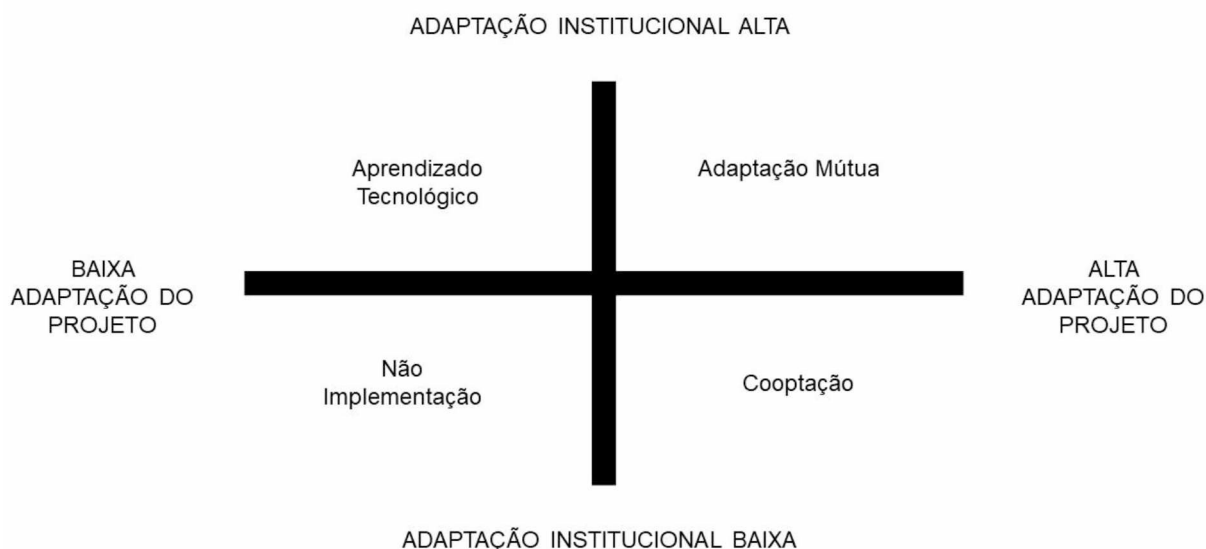
Figura 2 - Padrões de Implementação em Nível Local