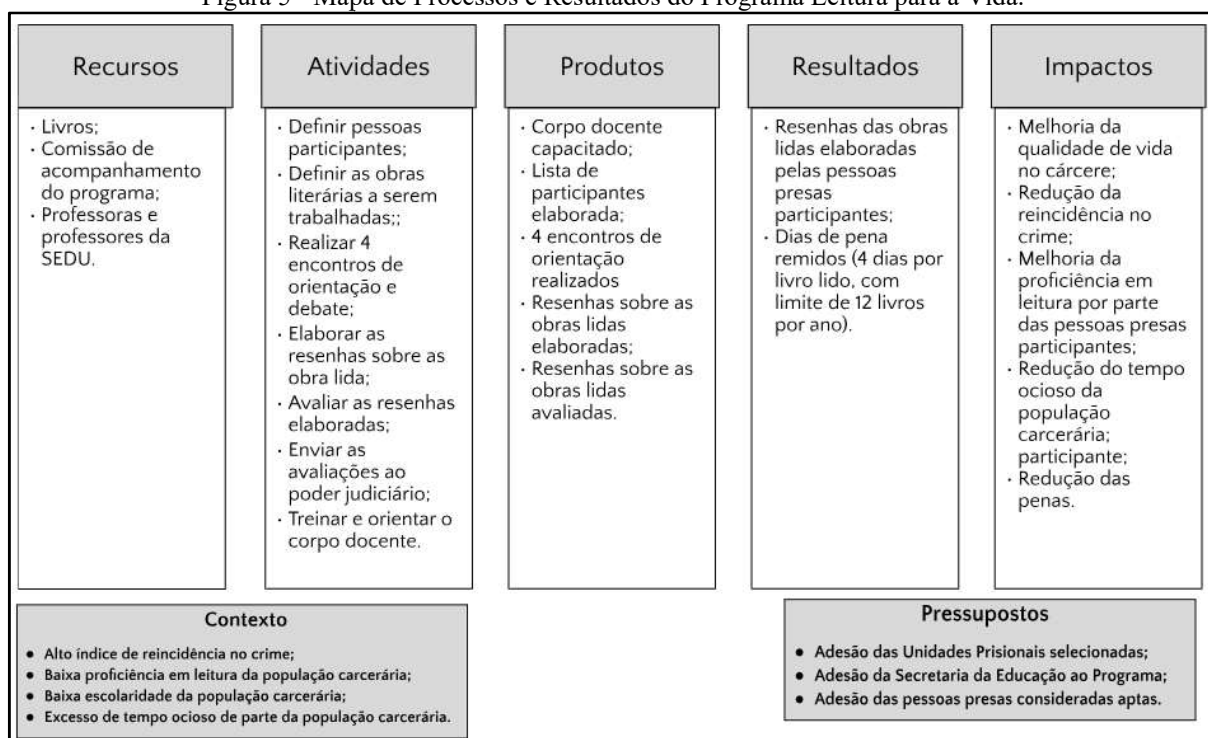
Figura 5 - Mapa de Processos e Resultados do Programa Leitura para a Vida.