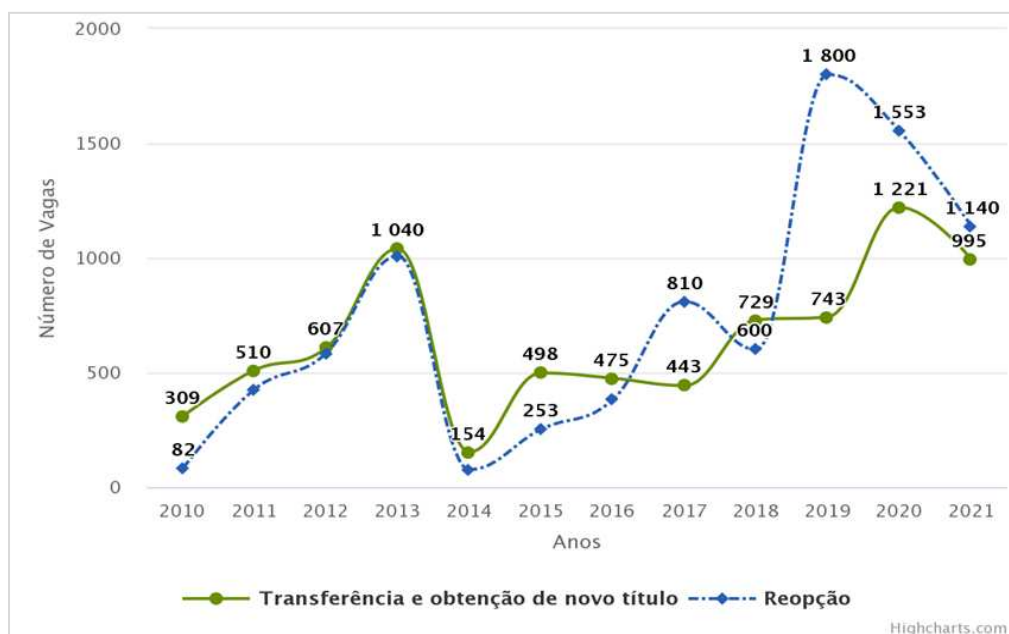
Gráfico 3. Evolução do número de ofertas de vagas remanescentes – UFMG