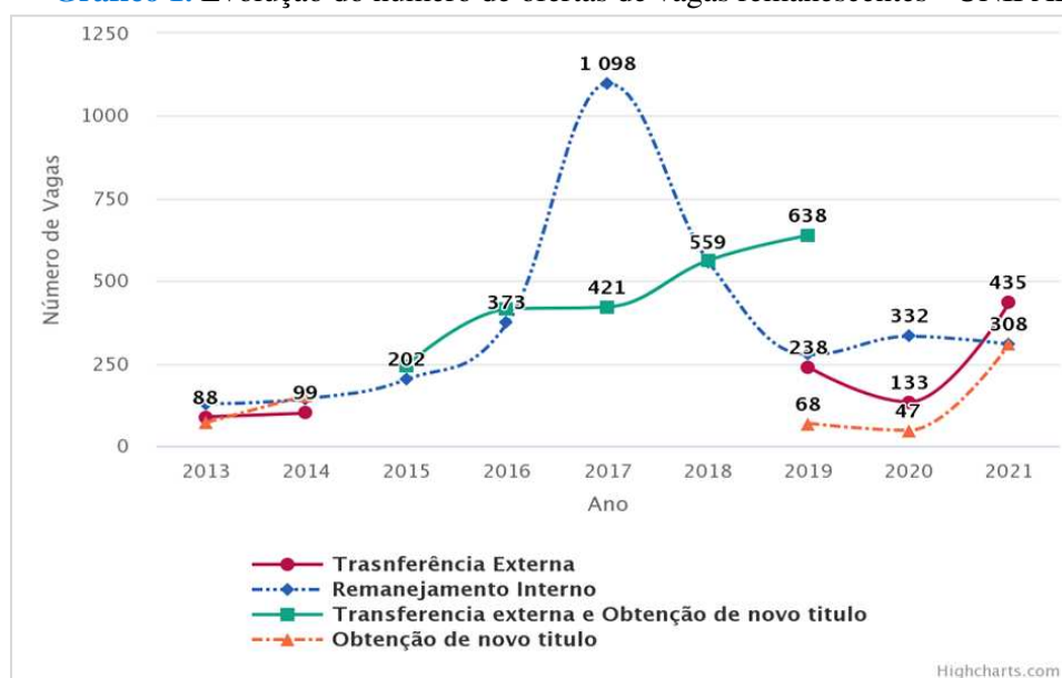
Gráfico 1. Evolução do número de ofertas de vagas remanescentes - UNIFAL-MG