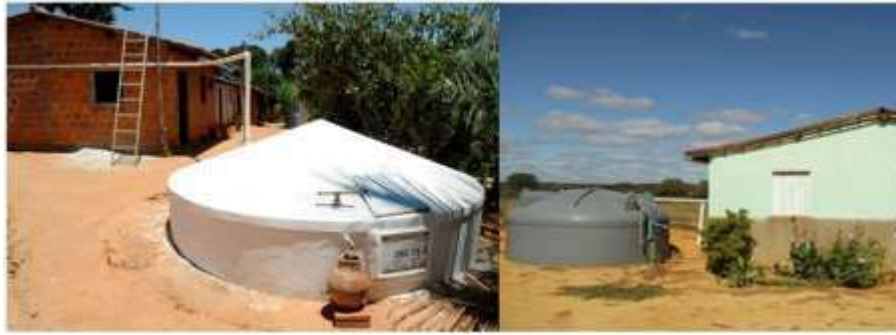
Figura 3 – Cisternas para captação de água de chuva para consumo humano: de placas de concreto à esquerda e de polietileno à direita.