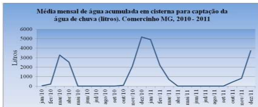
Gráfico 1 - Simulação da média mensal de água armazenada em cisternas para captação da água de chuva para consumo humano - consumo de 100 litros diários durante todo o ano. Comercinho, Minas Gerais, 2010-2011.

(1) Número de dias em que a família teve satisfeita sua demanda de 100 litros diários.