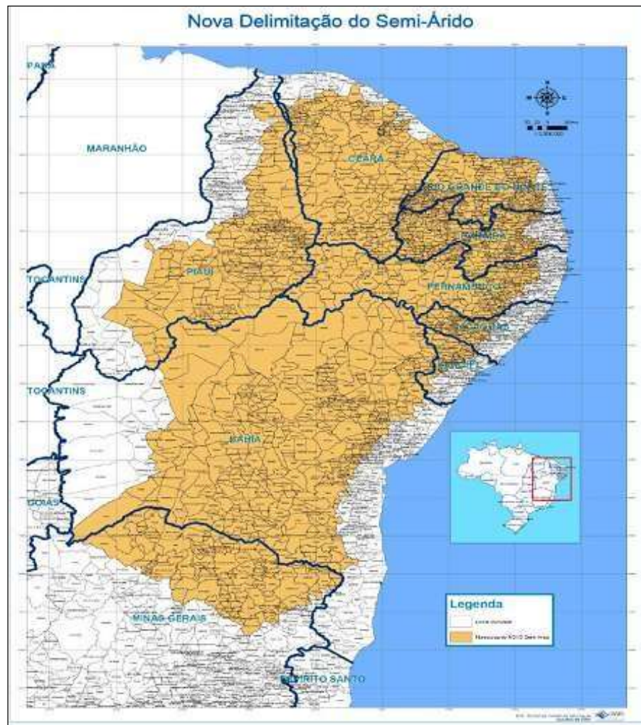
Figura 1 – Delimitação do Semiárido Brasileiro.

Os municípios que integram o Semiárido participam na maior parcela do Fundo Constitucional de Financiamento do Nordeste (FNE), que deve ter pelo menos 50% de seus recursos destinados a atividades produtivas na região. Fazem parte do Semiárido os municípios que possuem pelo menos um dos seguintes critérios: