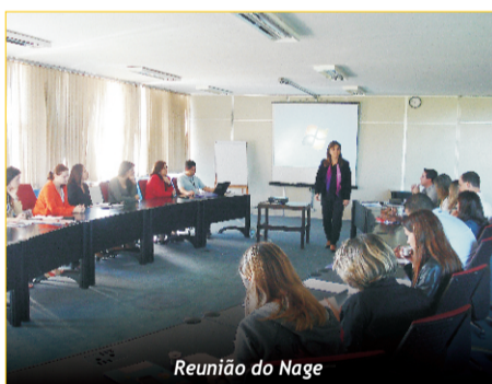
Reunião do Nage

Criado em 6 de dezembro de 2011 (Portaria nº 44/11), o Núcleo de Apoio à Gestão para a Excelência (Nage) é formado por 15 representantes das Unidades Administrativas da FJP. Em reuniões mensais, o grupo faz a análise crítica dos resultados institucionais, estabelece prioridades, monitora indicadores e produtos e realiza a implementação gradativa de práticas de gestão sistêmica alinhadas ao Modelo de Excelência da Gestão (MEG) e àquelas orientadas pelo Governo de Minas Gerais.