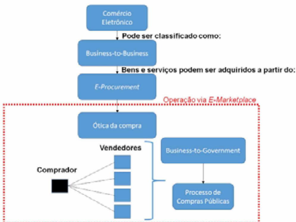
Figura 2: A relação entre E-Marketplace e Compras Públicas