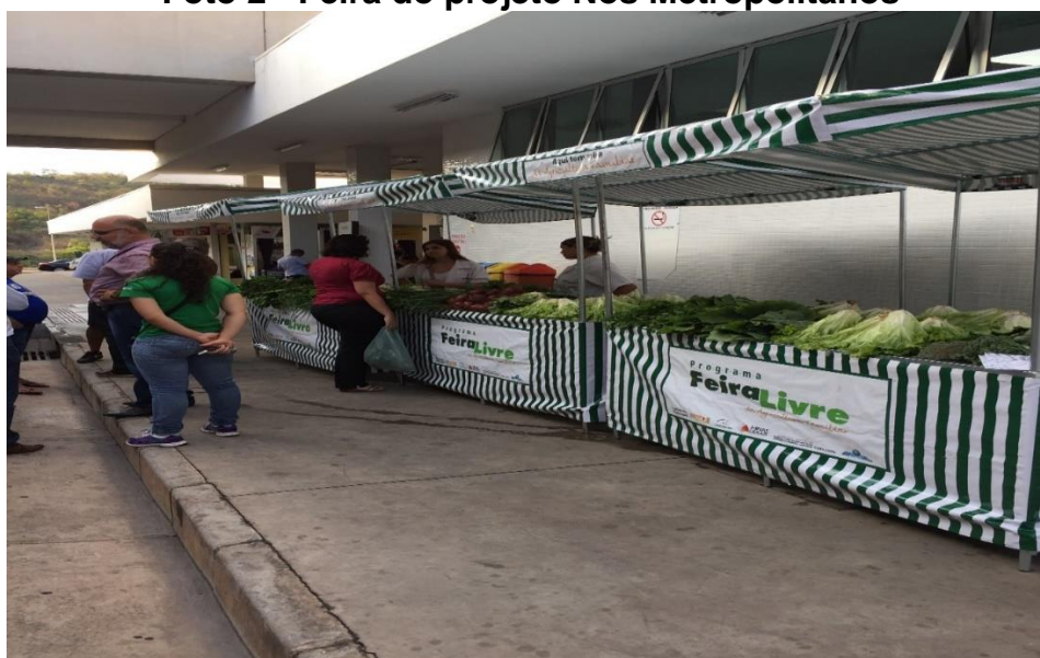
Foto 2 - Feira do projeto Nós Metropolitanos