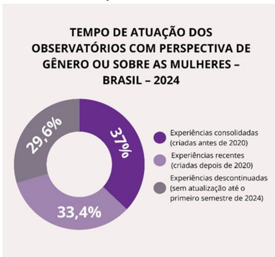
Gráfico 1: Observatórios com perspectiva de gênero ou sobre as mulheres por tempo de atuação – Brasil – 2024

Por fim, há outros dois observatórios criados em 2023: o Observatório da Violência contra a Mulher e Feminicídio da Secretaria de Estado da Mulher do Distrito Federal e o Observatório MulherES – Observatório de Políticas Públicas para as Mulheres no Espírito Santo do governo do Espírito Santo.