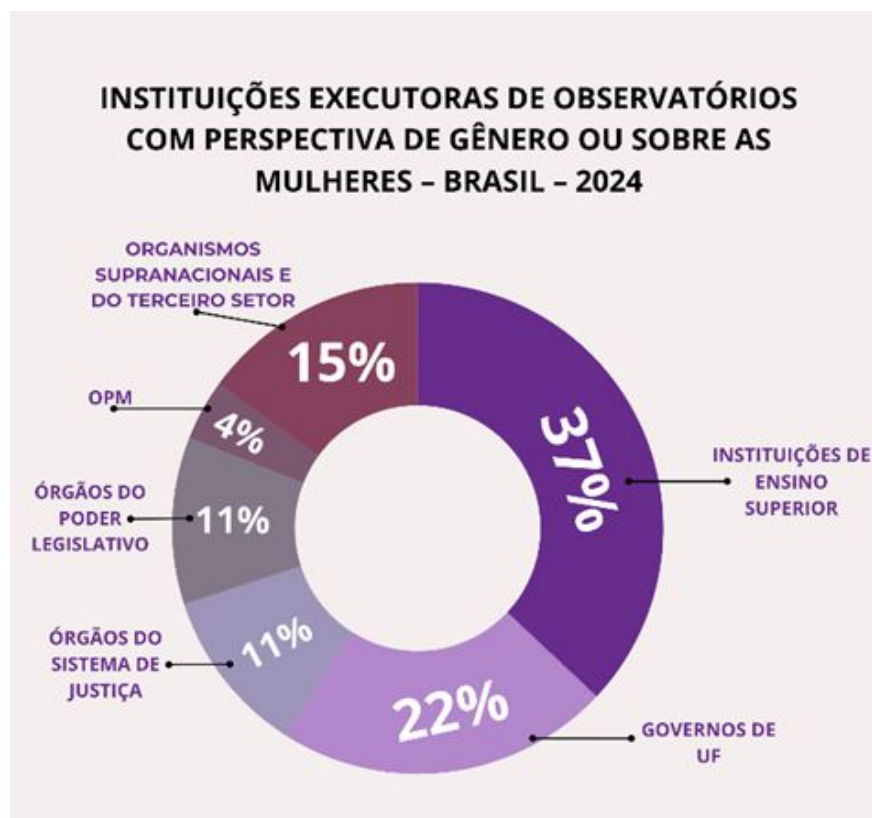
Gráfico 3: Instituições executoras de observatórios com perspectiva de gênero ou sobre as mulheres – Brasil – 2024

Além disso, apenas quatro (15%) dos 27 observatórios identificados pela pesquisa não são resultado de uma ação do poder público brasileiro 12 . A maioria absoluta (85%) dos observatórios com perspectiva de gênero ou sobre as mulheres no Brasil é fruto do trabalho das instituições federais e estaduais de ensino superior e pesquisa 13 (dez, o que equivale à 37% do total), de governos das Unidades Federativas 14 (seis, o que equivale a 22%), de órgãos do Poder Legislativo 15 (três, o que equivale a 11%), de órgãos do Sistema de Justiça 16 (três, o que equivale a 11%) e do organismo central de políticas para as mulheres, o Ministério das Mulheres (um, o que equivale a 4%). Portanto, conforme destacado no Gráfico 3, é o Estado que se movimenta na criação e na sustentação dos observatórios em questão, sendo que, conforme esses observatórios mantêm a violência contra as mulheres como foco central, mais uma medida de enfrentamento desse problema público é implementada pelo governo.