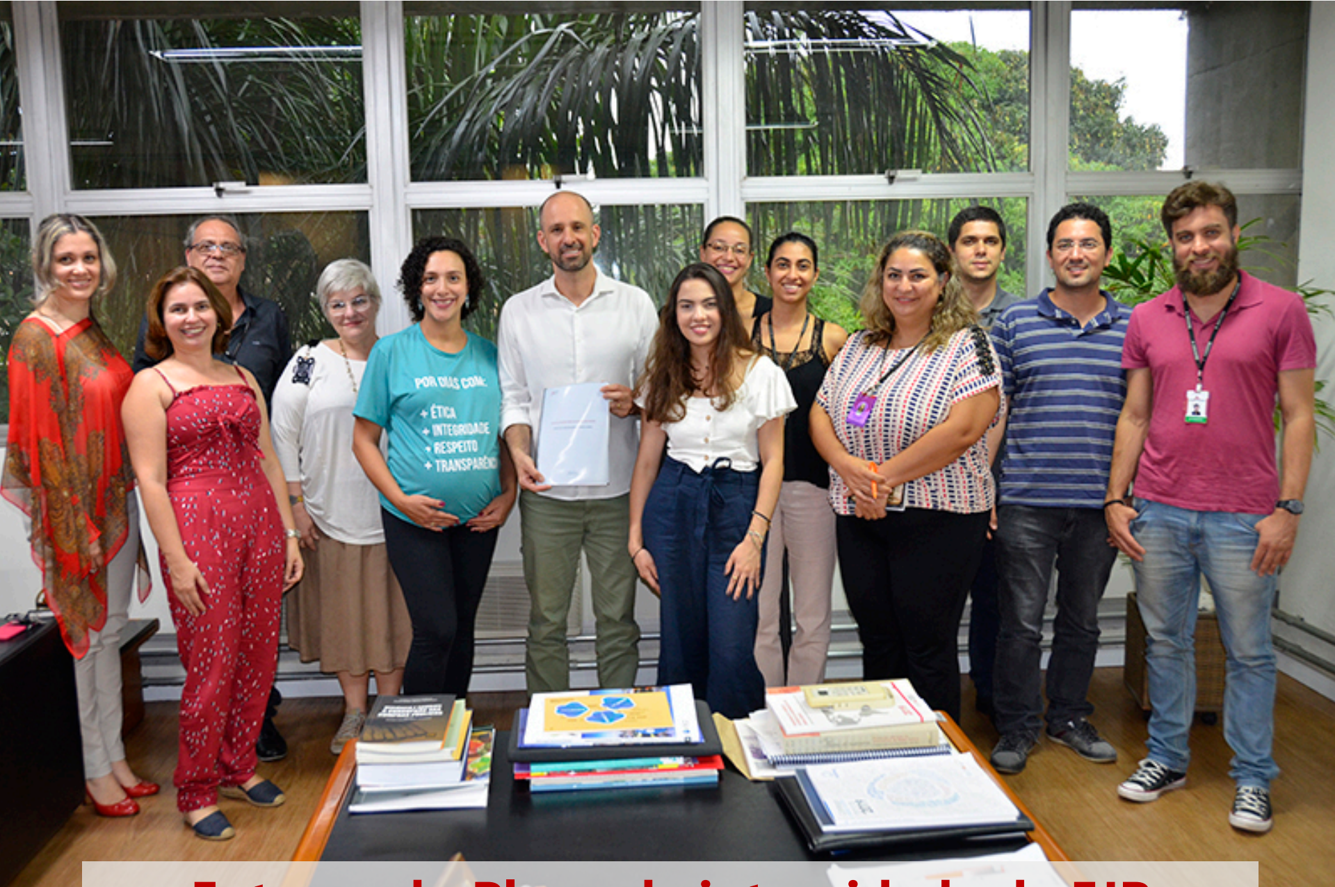
Entrega do Plano de integridade da FJP (Novembro)