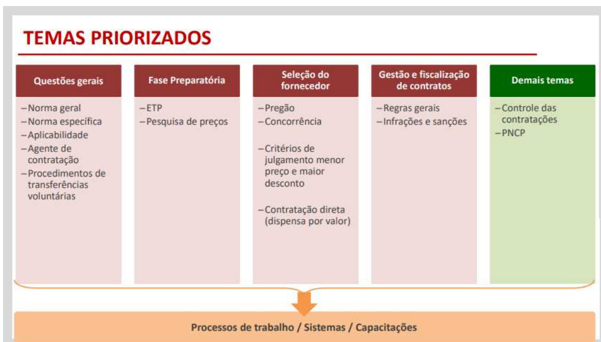
Figura 8: Temas priorizados inicialmente pelo GT-NLLC na implantação da NLLC

No âmbito de regulamentação dos temas e institutos trazidos pela Nova Lei, seguindo a lógica de que é necessário utilizar os regramentos da lei ponta a ponta do processo, os temas inicialmente priorizados foram: agente de contratação, estudo técnico preliminar (ETP), pesquisa de preços, dispensa de licitação por valor, pregão e concorrência nos critérios de julgamento menor preço e maior desconto, regras gerais de contratos e sanções administrativas (SEPLAG, 2022b). Os temas priorizados dentro das respectivas frentes de atuação estão representados na Figura 8 abaixo.