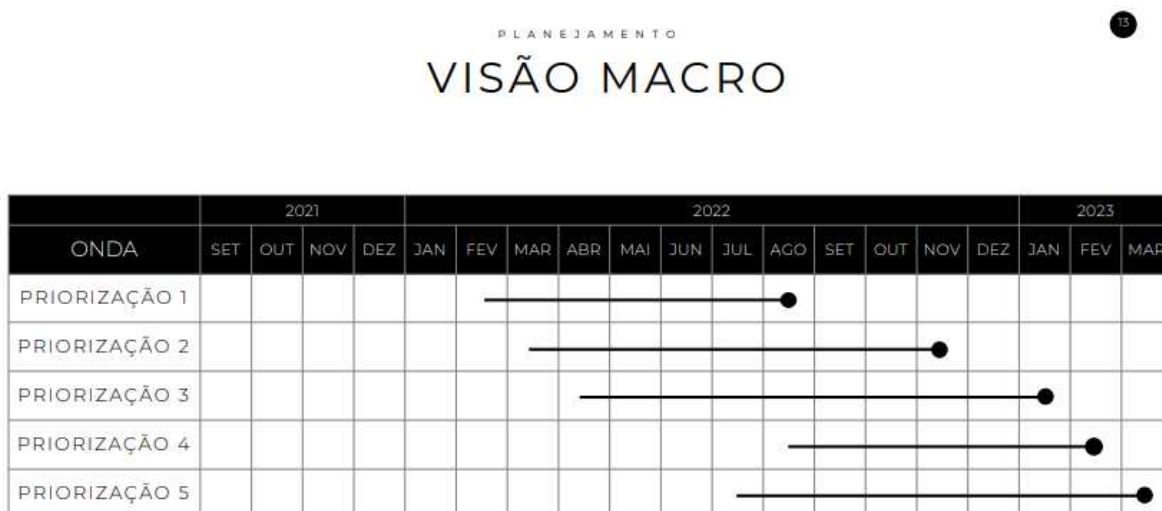
Figura 10: Visão macro das ondas de priorização planejadas pelo GT-NLLC em fevereiro de 2022