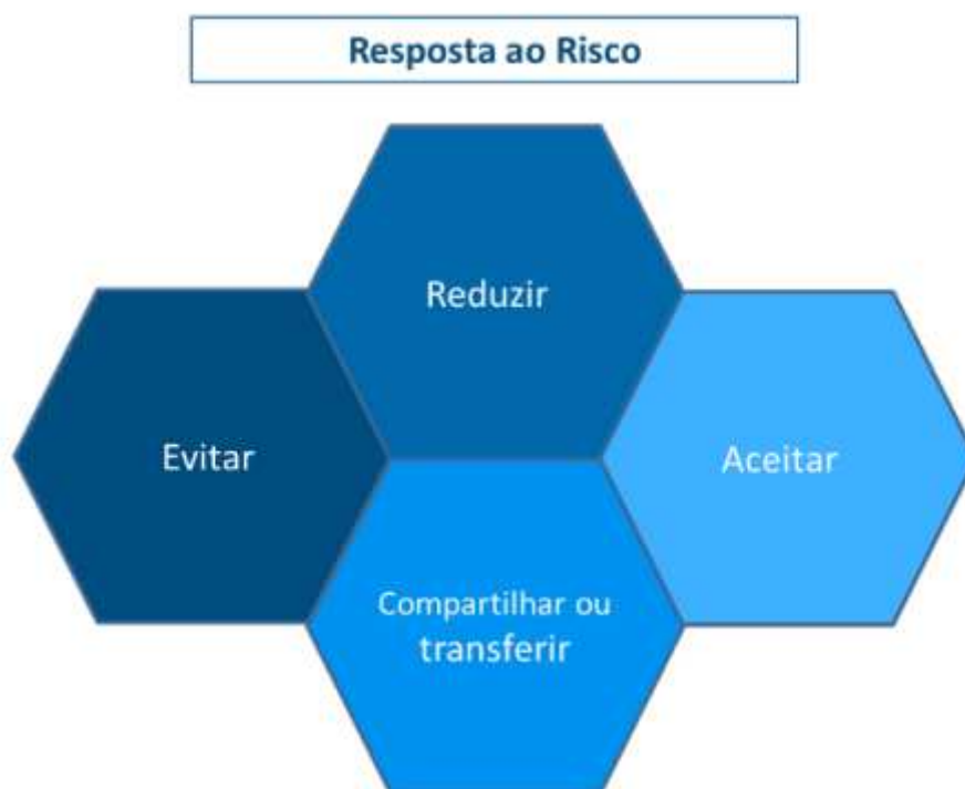
Figura 6: Opções de resposta ao risco

Dessa forma, Miranda (2024a) destaca em sua metodologia 4 opções de resposta a riscos: evitar , reduzir , compartilhar/transferir e aceitar , de acordo com a Figura 6 representada abaixo.