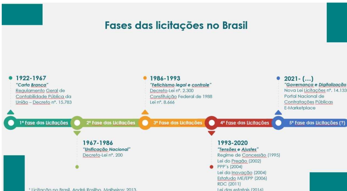
Figura 1: Linha do Tempo - Fases das Licitações no Brasil