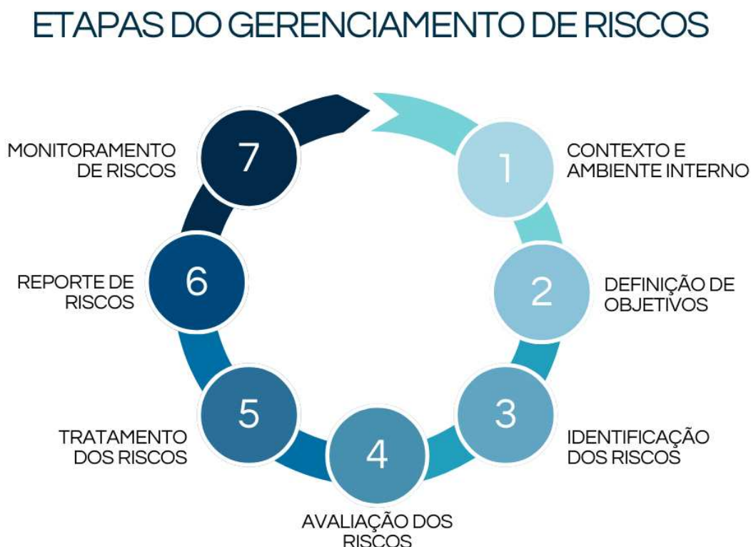
Figura 3: Etapas do processo de gerenciamento de riscos