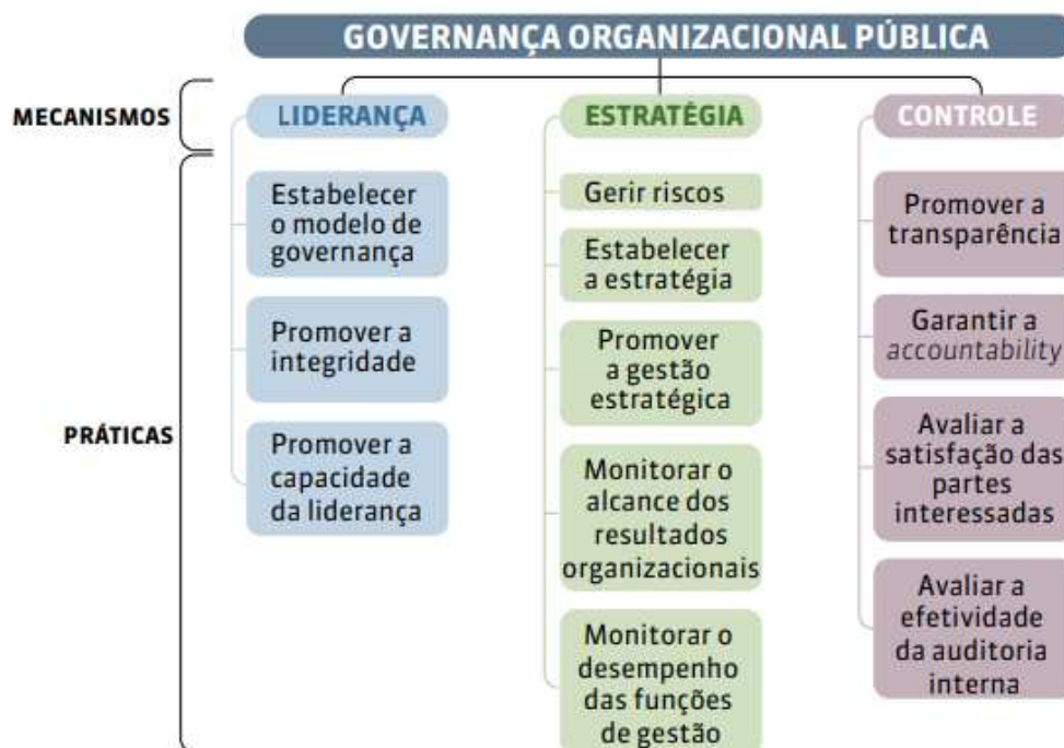
Figura 2: Mecanismos e práticas da governança organizacional pública