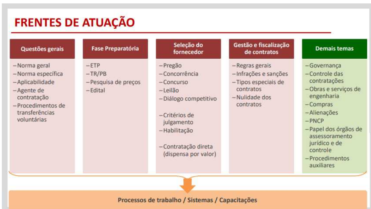
Figura 7: Frentes de atuação do GT-NLLC

Com base nestes orientadores, na estratégia adotada foi criada uma frente de trabalho para cada macroetapa do processo de compras públicas - fase preparatória, seleção do fornecedor, e gestão e fiscalização de contratos. Também foi estabelecida uma frente de trabalho para questões gerais, responsável por conteúdos relacionados à legislação como um todo, uma frente para demais temas, relativos a conteúdos que não se restringem a apenas uma etapa do processo de compras, e uma frente transversal, responsável por analisar e adequar as mudanças em processos e sistemas, e por realizar a capacitação dos servidores. As frentes de atuação, juntamente com alguns temas de cada uma estão representados na Figura 7 abaixo.