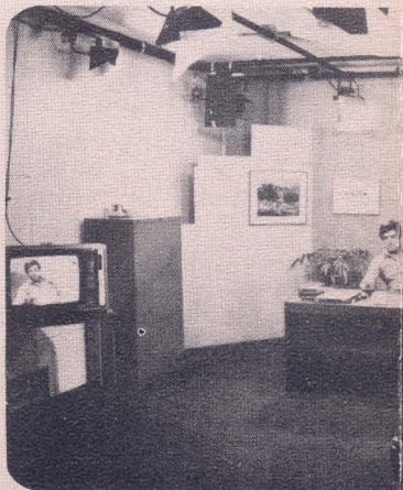
Tecnologia para o treinamento à distância

A metodologia de treinamento de adultos à distância utilizada no PTGE vem sendo desenvolvida pelo CDA/FJP desde 1980, com o apoio: