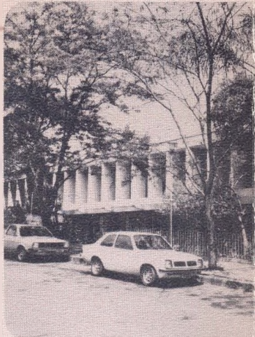
CDA/FJP: centro de excelência a nível

Com um corpo técnico permanente de 32 especialistas, o CDA/FJP encontra-se habilitado a desenvolver quaisquer projetos de treinamento, consultoria e pesquisa no campo da administração pública e privada.