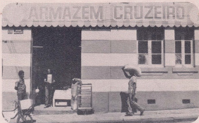
Pequena e média empresa, atenção especial do PTGE