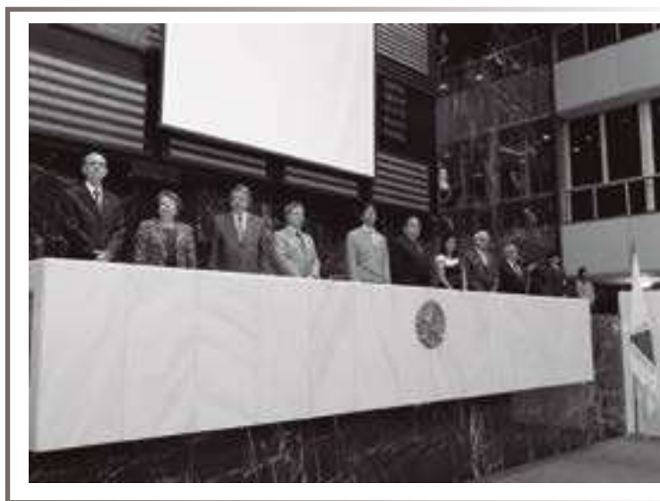
Entrega da medalha Professor Paulo Neves de Carvalho ALMG – 2012