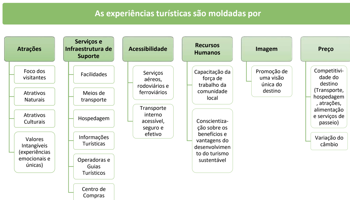
Figura 1: Elementos básicos de um destino turístico

De acordo com a Organização Mundial do Turismo (OMT), órgão da Organização das Nações Unidas (ONU) responsável pela elaboração universal de diretrizes e a promoção do turismo responsável, sustentável e acessível, um destino turístico é definido pelo espaço físico com ou sem limites administrativos no qual um visitante pode pernoitar. Esse espaço é formado por um conjunto de elementos básicos ofertados ao longo da cadeia produtiva do turismo em um determinado local (Figura 1).