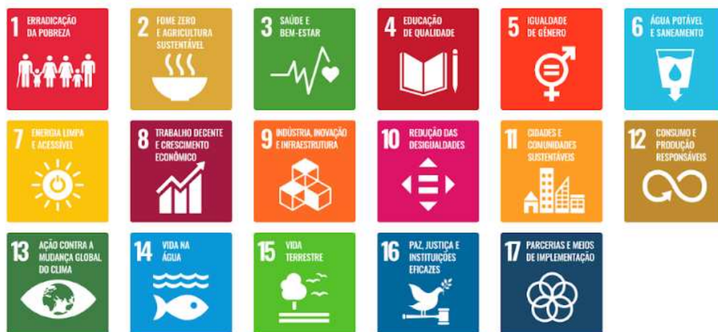
Figura 3: Objetivos do Desenvolvimento Sustentável